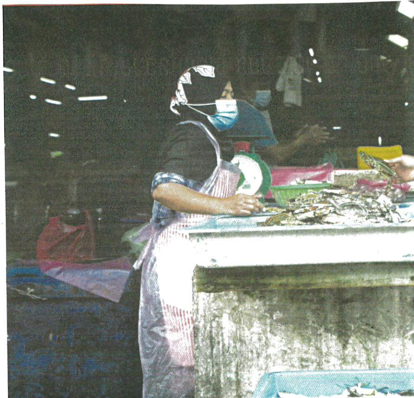
People doing their marketing at Selayang Market yesterday.