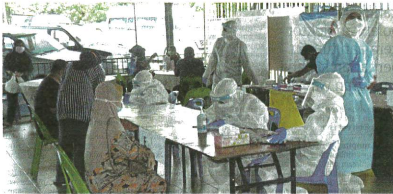
Penduduk Kampung Muhibbah Raya menjalani saringan di pekarangan Masjid Babus Saadah, di Tawau, semalam.

latif kes COVID-19 di Sabah adalah sebanyak 26,098 kes," katanya dalam kenyataannya, di sini semalam.