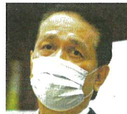
Dr Noor Hisham Abdullah

"Empat kluster yang tamat semalam, iaitu Kluster Kasih, Kluster Baiduri, Kluster Long dan Kluster Bestari. Ini menjadikan